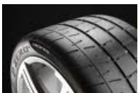
Pirelli P Zero Trofeo 235 40 18 Y, pro Stück