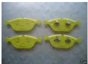
Sportbremsbeläge vorne Clubsport gelb Sportbremsbeläge vorne Strasse rot