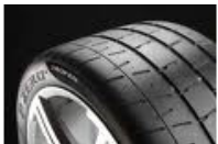
Pirelli P Zero Trofeo 235 40 18 Y, pro Stück