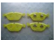
Sportbremsbeläge vorne Clubsport gelb Sportbremsbeläge vorne Strasse rot