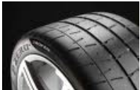
Pirelli P Zero Trofeo 235 40 18 Y, pro Stück