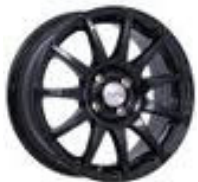
Arcasting Excalibur 8.0 x 18" ET44 pro Stück