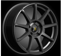
FrecciaDoro D3 Dark Titan 8.5 x 19" ET45 pro Stück