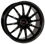
Team Dynamics Pro Race 1.2 ET40 8.0 x 18" Racing – Black , pro Stück